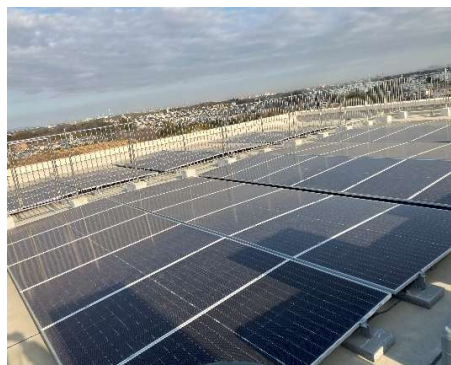
写真：横浜市立の学校への太陽光発電設備設置事例