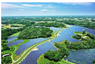
リエネ行方太陽光発電所 （茨城県行方市）