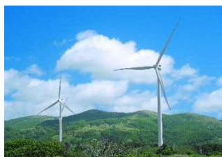
リエネ松前風力発電所 （北海道松前町）

これまで東急不動産は、総合不動産企業として都市再開発、宅地やリゾートなど大規模なまちづくりをはじめ、多岐にわたる開発事業を行ってきました。地域・社会・環境にかかわる様々な課題と向き合い解決策を模索する中で培われてきた経験はReENEの中でも活かされています。