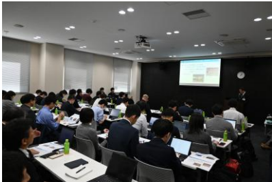
《セミナー開催中の様子》

1月30日のセミナー当日は、全国の自治体から多くの職員の皆さまにご参加いただきました。 参加者の皆さまからは「なかなか聞けない貴重な『事業化に至る経緯』が聞けてよかった」「長寿命化、複合化などこれからの公共施設に必要な知識を学ぶことができた」などのお声をいただくと共に、現地視察にご参加いただいた方からは、「ふらっとすぎはちの検討経緯と、指定管理者による運営の工夫が聞けてよかった」などのご感想も多数いただきました。