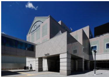
《セッション杉並 外観》