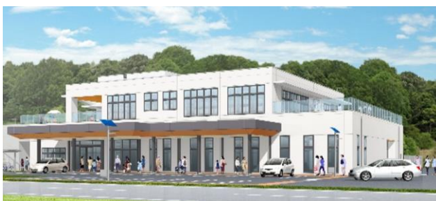
《複合施設パース（音楽スタジオ・多目的室等）》

※掲載内容（画像、文章等）の一部および全てに関し、無断で複製、転載、転用、改変等の二次利用を固く禁じます。