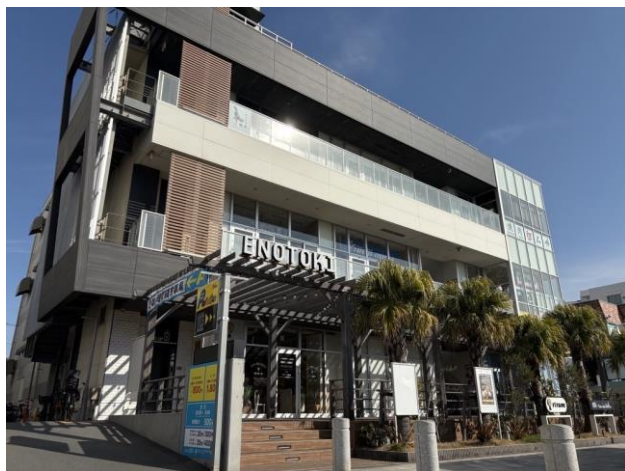
《船をイメージした外観》

当社の運営管理の実績・知見を活かし、テナント様・お客様に安心、安全・快適な空間をご提供できるよう、最適な管理運営に従事してまいります。また、地元住民と共に賑わいを創出できるよう管理の側面から力強くサポートしてまいります。