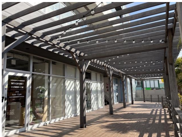
《開放感と賑わいを演出する広々としたテラス》

※掲載内容（画像、文章等）の一部及び全てに関し、無断で複製、転載、転用、改変等の二次利用を固く禁じます。