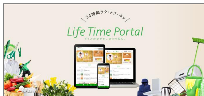
「Life Time Portal」