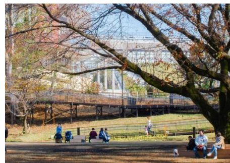
隣接する南町田グランベリーパーク との一体整備「鶴間公園」