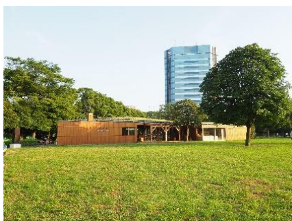
都立木場公園多面的活用プロジェクト 「Park Community KIBACO」