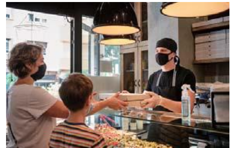
多彩な食を楽しむフードホール（イメージ）

さらに、緑を感じることができる植栽計画や広場設計に加え、壁面緑化や屋上菜園の整備、東京都多摩産材を活用した建築計画、100%再生可能エネルギーの活用など、環境配慮型の公園整備・運用を行います。