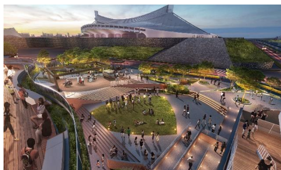
にぎわい広場（夜）のイメージ