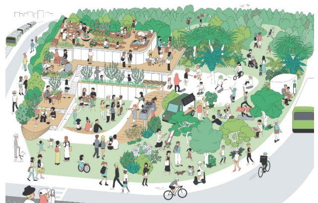
多彩なアクティビティのイメージ ※3