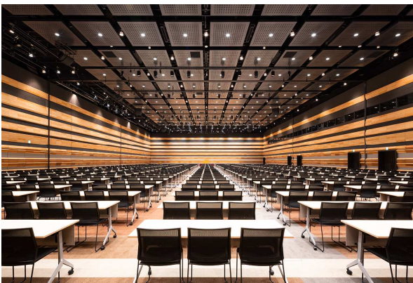
コンベンション大ホール