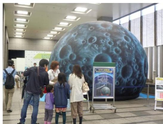
移動式プラネタリウム（エアドーム）

今、商業施設は来場されたお客様が買い物をするだけでなく、家族で楽しく時間を過ごし、体験を共有する場所としての役割が注目されています。東急コミュニティーでは、商業施設などのオーナー向けに施設の魅力となり、集客を狙いとしたイベントとして、本サービスをご提案してまいります。